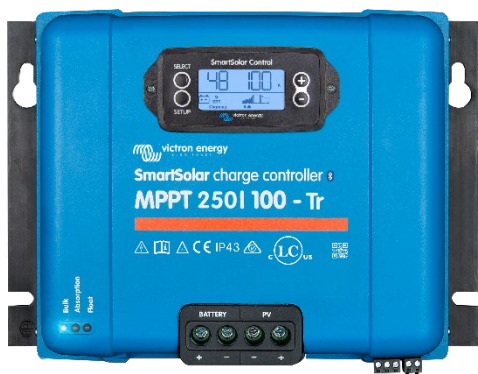
Contrôleur de charge SmartSolar MPPT 250/100-Tr avec un écran enfichable en option