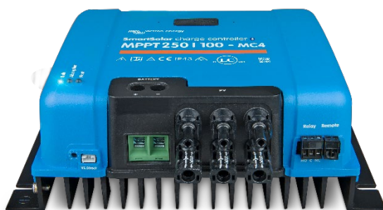
Contrôleur de charge SmartSolar MPPT 250/100 MC4 sans écran